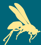
AVISPA CHAQUETA AMARILLA